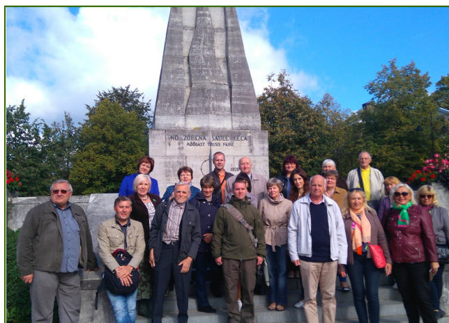
21. septembris. LMNA Informatīvās dienas dalībnieki pēc Cēsu skaistāko vietu apskates.

Viesi— LMNA arodorganizāciju vadītāji - tika iepazīstināti ar a/s "Cēsu alus" ražošanas procesu un bija iespēja arī nodedūstēt ražoto produkciju.